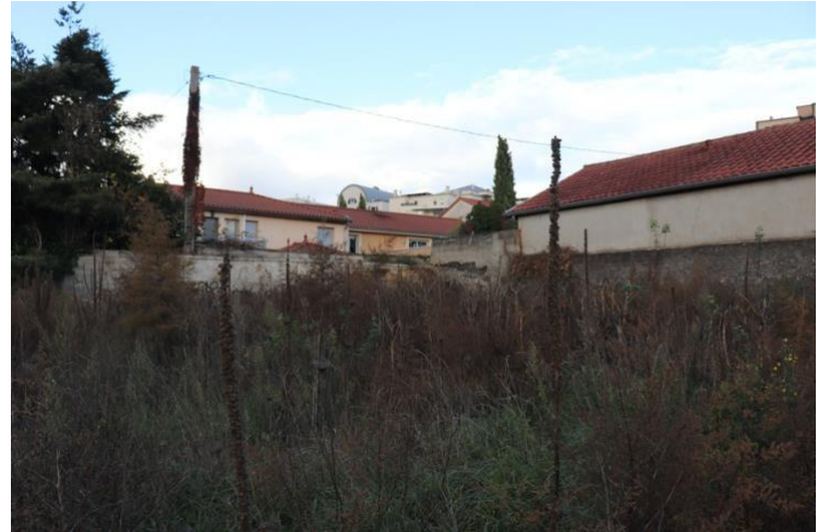
La parcela donde se construirán las tiny houses en Lyon, Francia.