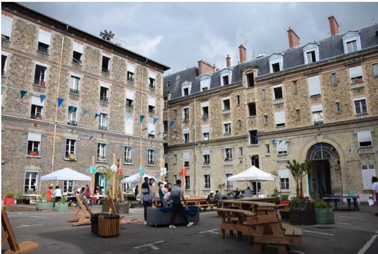
Habitatges socials per a migrants, Les Cinq Toits en París, França.

4. La creixent politització de l'acolliment i l'allotjament de persones refugiades en els últims anys suposa un obstacle, ja que existeix un discurs favorable a la detenció i a les polítiques d'asil restrictives. Les agendes polítiques (per exemple, les eleccions presidencials franceses), la crisi sanitària i el creixent populisme que afecta els països europeus representen un repte important per als responsables polítics que opten per mesures d'acolliment més restrictives per satisfer les expectatives de la població local. La politització de l'acolliment de migrants divideix a la població a tota Europa, la qual cosa a vegades provoca enfrontaments entre residents locals i immigrants.