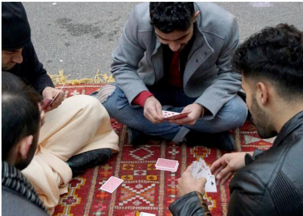
Migrants en Les Cinq Toits en París, França.

Després d'analitzar les iniciatives en matèria d'habitatge i les polítiques d'integració en els quatre països, en particular a França, Espanya i Itàlia, constatem que les activitats de les ONG milloren i faciliten clarament l'aplicació de les polítiques d'integració. A més, les activitats de les ONG satisfan les llacunes governamentals en la provisió d'habitatge a persones refugiades i migrants. Això ofereix flexibilitat, varietat d'enfocaments adaptats localment i una reacció ràpida en el context de la creixent necessitat d'habitatge per a les persones refugiades des de 2015.