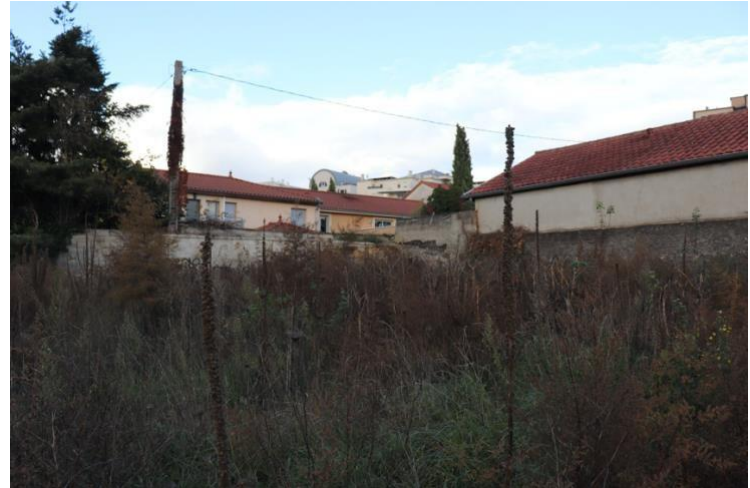
La parcel·la on es construiran les tiny houses a Lió, França.