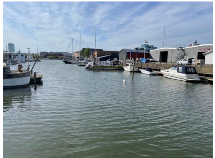
La zona de Ringön on atracarà la casa flotant a Göteborg, Suècia.

La consecució de legitimitat d'una política pública depèn d'en quina mesura tant els resultats socials de la seua implementació com la forma en què s'aconsegueixen són considerats apropiats per les persones responsables polítiques, per les executores de les polítiques públiques i pel conjunt de la població. Per mantindre l'èxit al llarg del temps és necessari que les principals parts implicades en el procés mantinguen coalicions per difondre de manera persuasiva l'èxit de la política i influir en les percepcions de les elits i la ciutadania sobre la intenció i els resultats de la política pública.